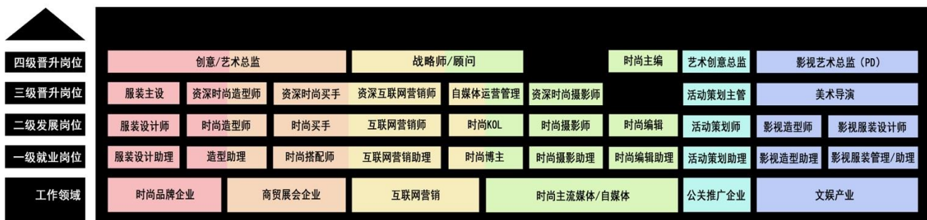
图1 服装与服饰设计专业职业生涯规划图

为实现学历教育与职业资格认证的内涵衔接和对应,根据专业培养目标,服装与服饰设计专业专科阶段主要围绕服装与服饰设计、人物形象设计等岗位考取国家认证的职业资格证书。职业证书的获取要与课程内容紧密结合,在学生完成对应的课程之后,参加统一技能考试,以获得对应等级的职业资格(技能)证书。证书分必考证书和选考证书。