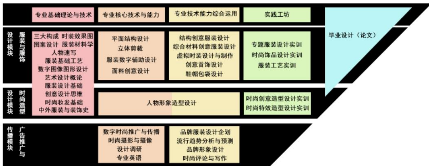
图2 服装与服饰设计专业课程设计理念

围绕服装与服饰设计人才的培养目标，积极吸纳行业专家和用人单位参与课程体系建设，重视基础知识和综合技能掌握，构建以专业核心应用能力为本的课程体系，加强校企合作课程的实施，执行学历证书和职业证书的制度。根据服装与服饰设计职业能力要求及培养规律，结合高等职业院校和本科院校的原有办学特色和专业亮点，由专业基础理论与技术课程、专业核心能力与技术课程、专业能力拓展与技术迭代类课程及专业能力与技术综合运用实践类课程构成梯度渐进的教学层次，形成整体“重应用、强创意、宽口径”的课程体系。