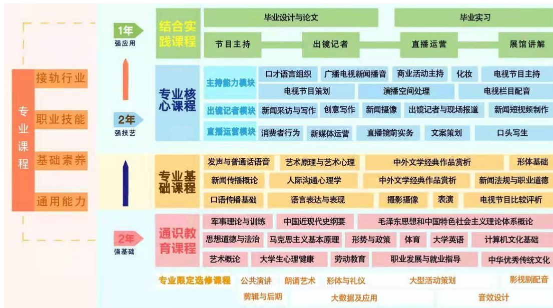
图2 播音与主持艺术专业课程体系设计

办学特色和专业亮点，由“主持能力模块、出镜记者模块、直播运营模块”三大类课程构成，形成三方交互立体培养的课程体系。